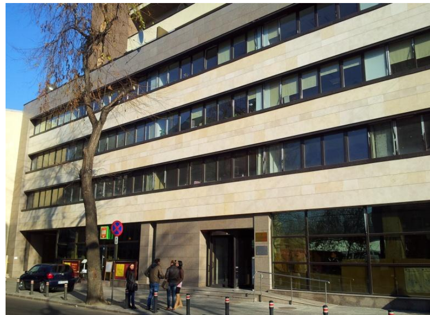
Mihai Eminescu nr. 163, Sector 2, Bucuresti

✓2007-2020 - Organism Intermediar pentru Regio